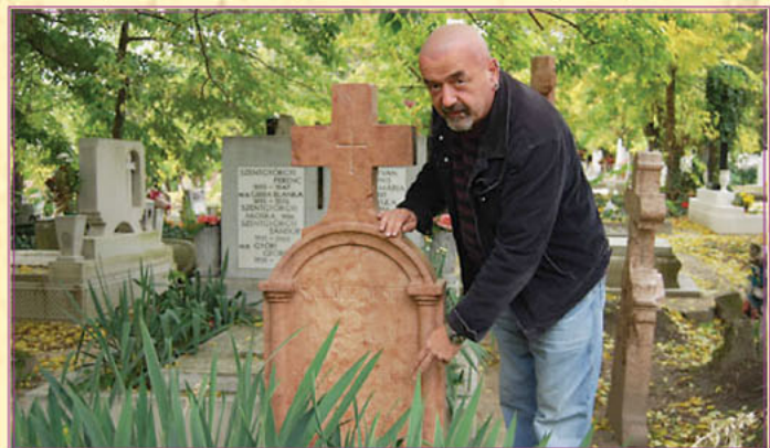
Szöveg és fotó: Puskás Béla

A tanár úr a magyar állam és a helyi önkormányzatok súlyos adósságát próbálja saját eszközeivel helyrehozni. Meggyőződéssel vallja, hogy a katonasírok, valamint neves elődeink sírjainak gondozása nem csak erkölcsi kötelességünk, hanem saját önbecsülésünk, nemzettudatunk erősítése miatt is nagyon fontos. Áldozatos munkáját számos helyszín és rendezvény fémjelzi.