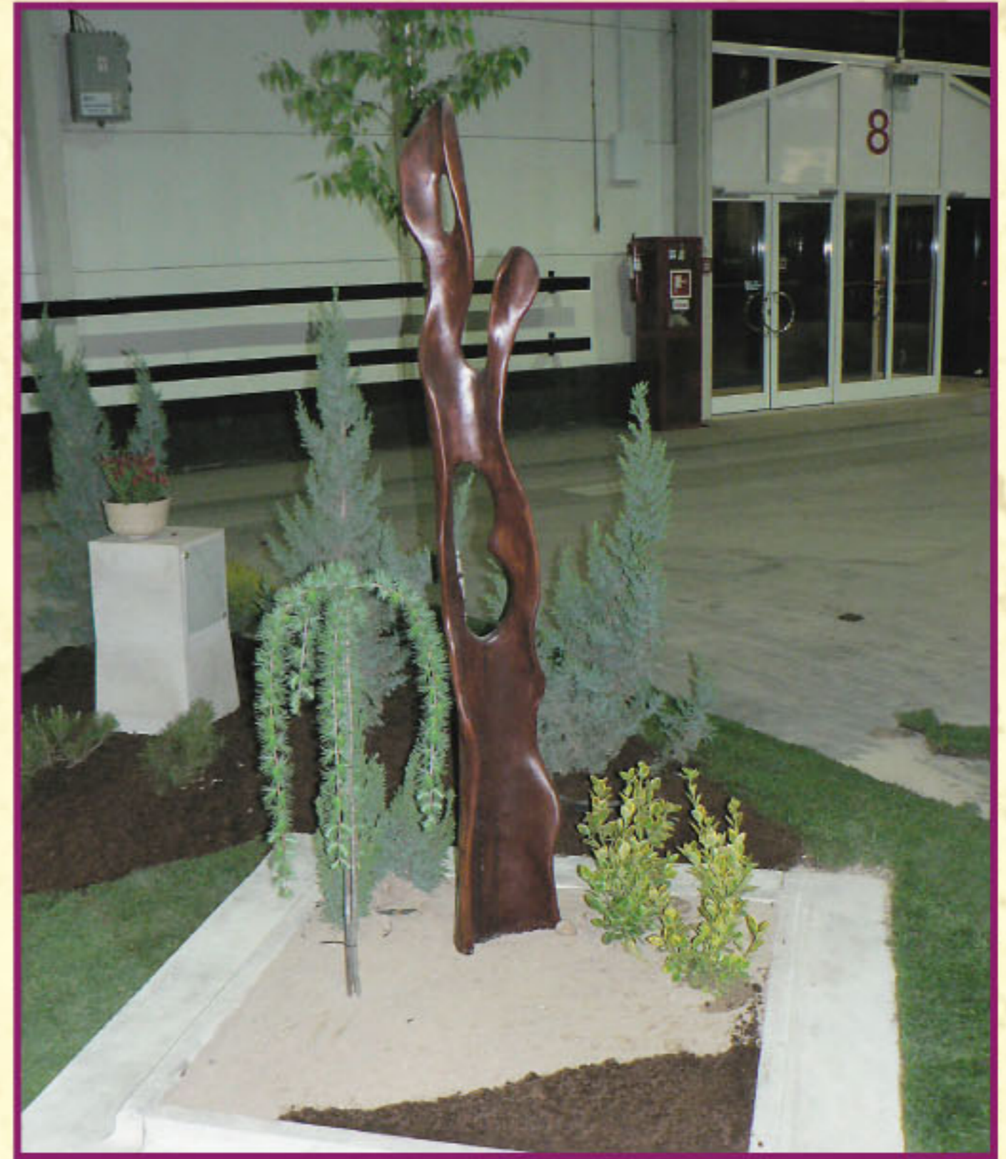
Floralia Budapest 2008