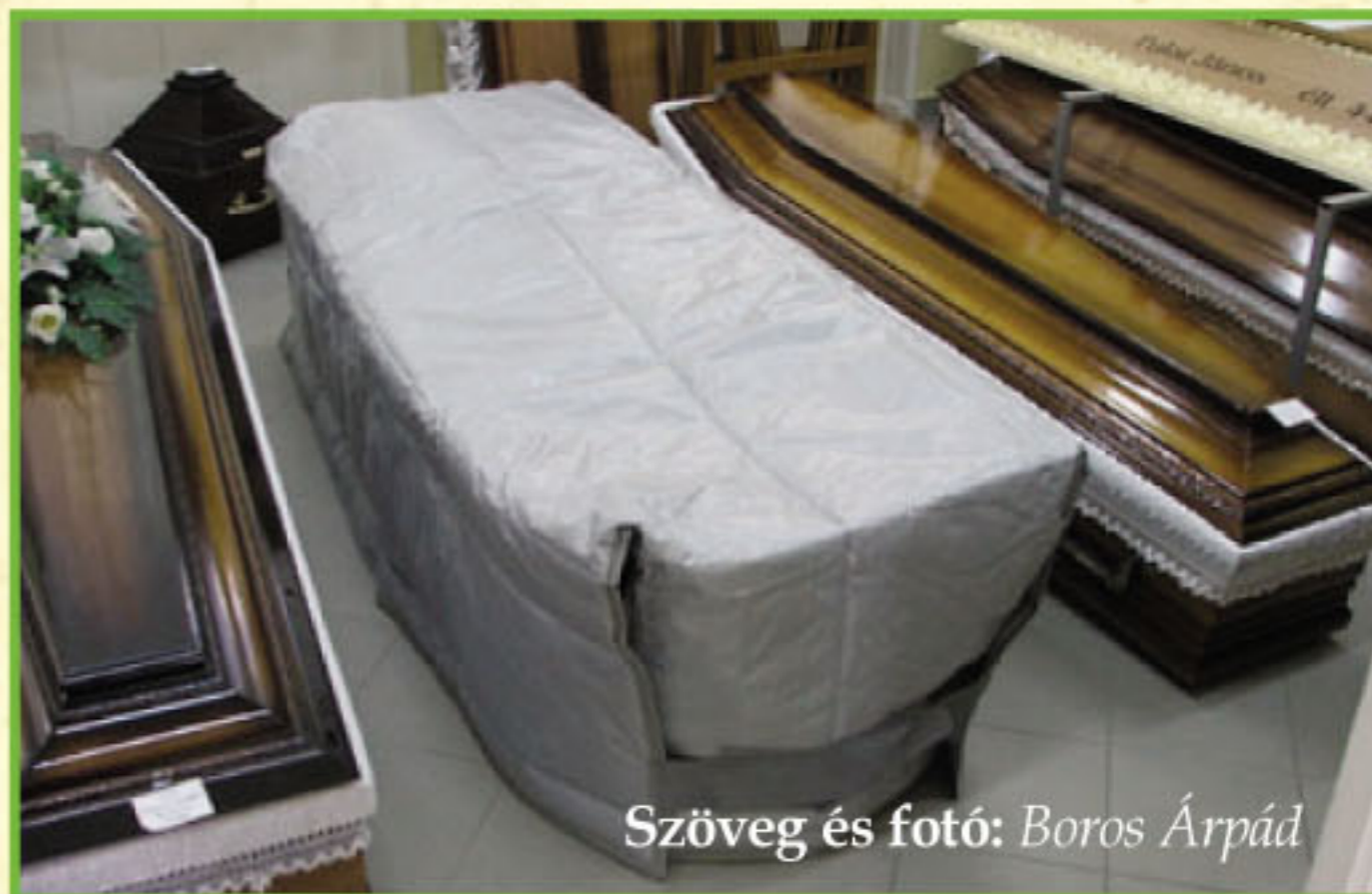
Szöveg és fotó: Boros Árpád

Összehajtott állapotban a CTP a halotyszállító gépkocsiban jól elhelyezhető és szükség esetén könnyen használatba vehető, így hasznos új eszköz lehet kellék-tárunkban.