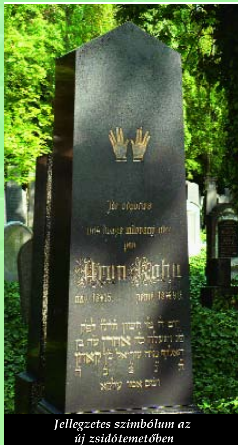
Jellegzetes szimbólum az új zsidótemetőben

Mivel a temetőt temetkezésre utoljára a 18. sz.-ban használták, így Kafka síremlékét nem itt, hanem az új zsidó temetőben találhatjuk, mely Prága más részén található.