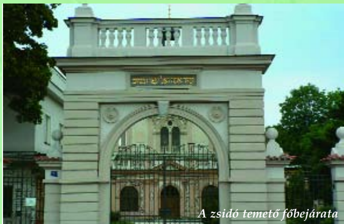
A zsidó temető főbejárata

Ha az ember a temetkezésben érdekelt, bárhová is vetődik útja során, mindig különös figyelmet fordít a helyi temetőkre, és temetkezési szokásokra. Így vagyok ezzel jómagam is, és ez a fajta szakmai érdeklődés, már-már szokásommá vált nem csak konkrét szakmai, de privát útjaim során is. Így került a figyelmem központjába egy prágai hosszú hétvége során az ottani zsidónegyed, és ezen belül is az ősi zsidótemető, mely egyedülálló emlékhelye, az itt élt zsidóközösségnek.