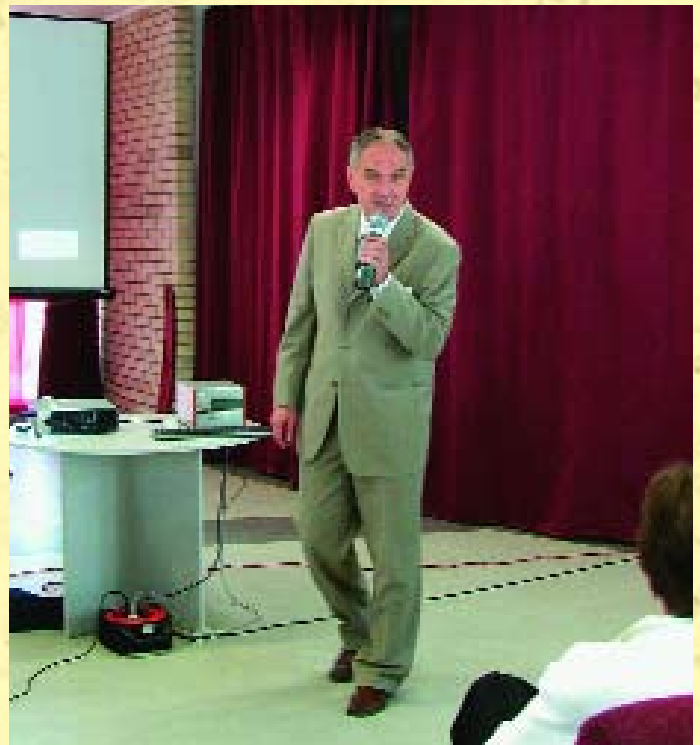
Szita Károly Kaposvár polgármestere

Fenntartóként nagy a felelősségük az Önkormányzatoknak, azokkal szemben, akik már nem élnek, s azokkal szemben is, akiknek szeretteik nyugszanak a temetőben. A Kaposvárhoz