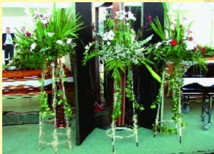
A Temetőkertészek és Fenntartók Egyesülete által szervezett TEMETŐKERT 2006 Konferencia és Kegyeleti Szakkiállítás 2006 Kaposvár