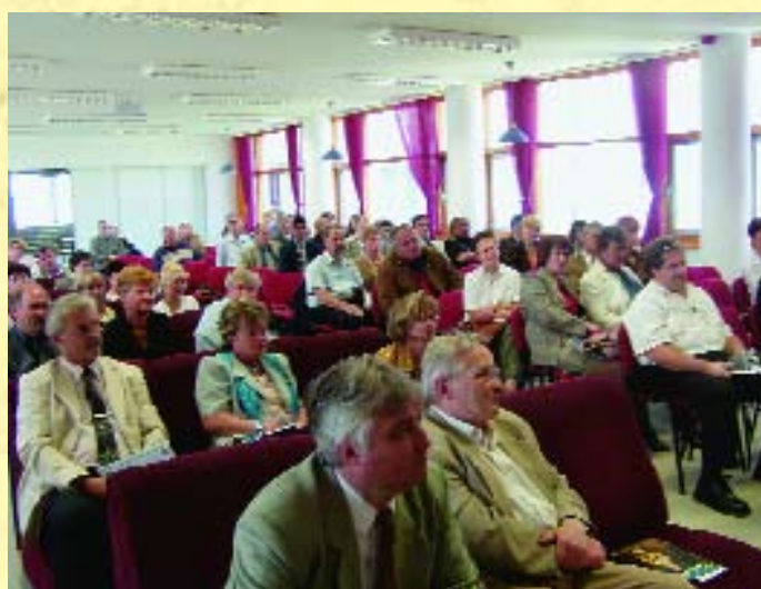
A szép számmal megjelent kegyeleti szakma képviselői érdeklődéssel hallgatták az előadásokat